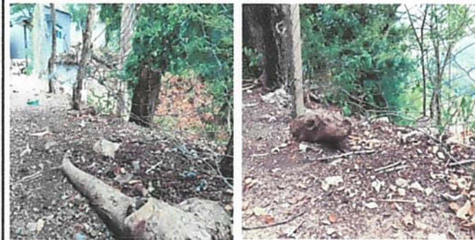
FOTO 1: AGUJEROS QUE PERMITEN EL INGRESO DE PERSONAS AJENAS AL ESTABLECIMIENTO Y DE ANIMALES DE CORRAL